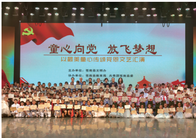
苍南县文化馆举办“童心向党 放飞梦想”——以最美童心传颂党恩文艺汇演