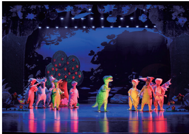
平阳县首次引进的儿童剧《我不是霸王龙》在该县艺术中心大剧院上演