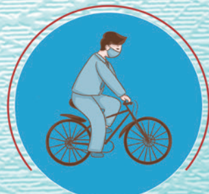
少使用公共交通工具