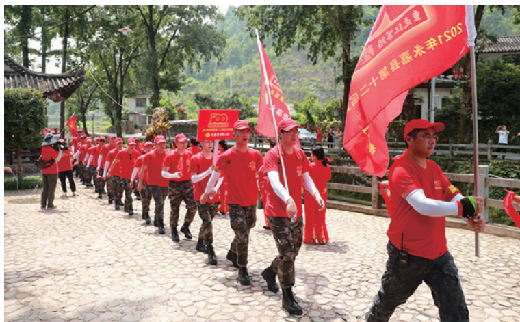
永嘉县第十二届重走红军路活动

队员们你追我赶，互相鼓励，互相帮助，克服困难，当天下午 1 时左右，经历了 4 个多小时的徒步行军，陆续到达终点红十三军教育基地广场。在纪念碑前，全体队员向纪念碑敬献花篮，表达对先辈们的崇敬之情。