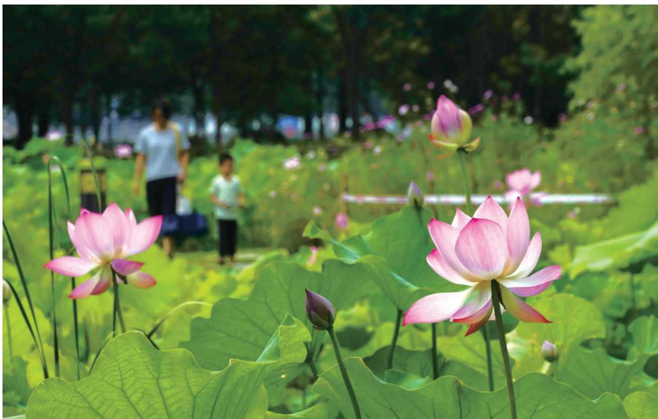
白鹿洲公园荷花池

近日，中宣部、中央文明办、全国妇联在京召开推进家庭家教家风建设座谈会。中共中央政治局委员中宣部部长、中央文明委副主任黄坤明出席会议并讲话，强调要以《习近平关于注重家庭家教家风建设论述摘编》出版为契机，深入学习贯彻习近平总书记重要指示精神，大力加强家庭文明建设，广泛弘扬社会主义家庭文明新风尚，汇聚亿万家庭的力量奋斗新时代、奋进新征程。