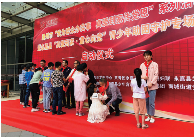
永嘉开展“我为群众办实事”系列活动暨永嘉县“真爱到家·童心向党”青少年助困守护专场活动

苍南县文明中心联合县教育局、团县委、妇联在苍南县文化馆举办“童心向党 放飞梦想”——以最美童心传颂党恩文艺汇演，献礼建党百年，推动党史学习教育活动走深走实。来自苍南全县的 200 余名新时代少年通过歌声、舞蹈、朗诵、情景剧等形式，用灿烂的笑容、稚嫩歌声、真挚的感情、最美的童心唱响一曲曲红色歌曲，献礼中国共产党成立 100 周年，表达对祖国