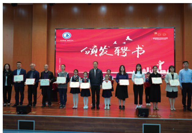
瓯海“红色根脉”党史学习教育宣讲启动仪式

“穿越一百年的时光距离，以一颗虔诚的心，走进祖国百年画卷。”近日，温州市实验小学开展了“领巾闪耀向党，百年党史我来讲”系列活动之红色演讲大赛。这些故事中，既有艰苦卓绝的奋斗史，也有描绘新中国