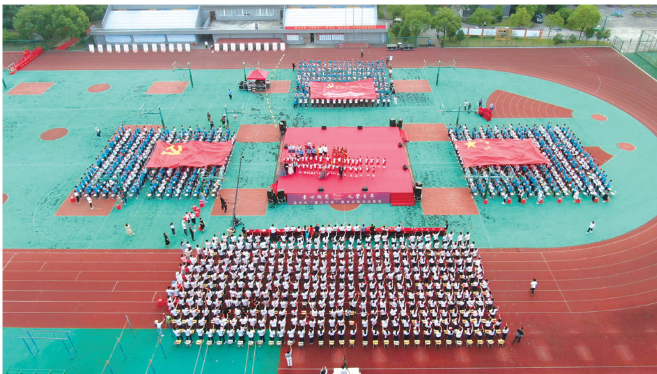
6月8日下午，温州市“童心向党”教育实践活动展演暨庆祝中国共产党成立100周年文艺汇演活动在潘桥中学举行

经典，礼赞百年华诞，用激昂嘹亮的歌声，表达爱党爱国之情；开展“党的光辉照我心”活动，组织青少年观看红色影片、参观革命旧址、缅怀革命先烈，聆听革命、建设和改革的故事，引导青少年明白今天的幸福生活从哪里来，明白努力学习、健康成长是为了什么；开展“党的故事我来讲”活动，组织青少年讲述党的故事、革命