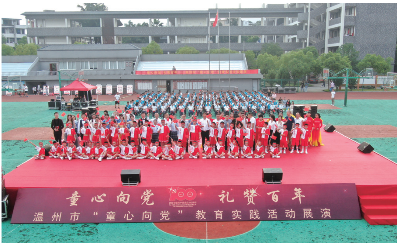
6月8日下午，温州市“童心向党”教育实践活动展演暨庆祝中国共产党成立100周年文艺汇演活动在潘桥中学举行

紧接着，学生们相继表演了群舞《活着1937》、红歌联唱《不忘初心》、歌伴舞《祝福祖国》、诗歌朗诵《百年峥嵘岁月》、鼓艺表演《我爱你中国》等精彩节目，为现场观众带来了一场丰盛的艺术大餐，赢得台下阵阵热烈掌声。