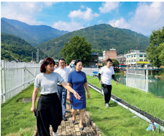
温州市委常委、宣传部长胡剑谨带队到瓯海区开展全国文明城市建设督查活动

为常态长效推进全域文明创建工作，温州市制定了打造全域化高水平文明城市三年行动方案（2021-2023年），提出实施城市秩序管理提升、城市面貌优化提升、文明细胞聚力提升等“八大提升计划”，为打造新时代文明高地绘就新蓝图。