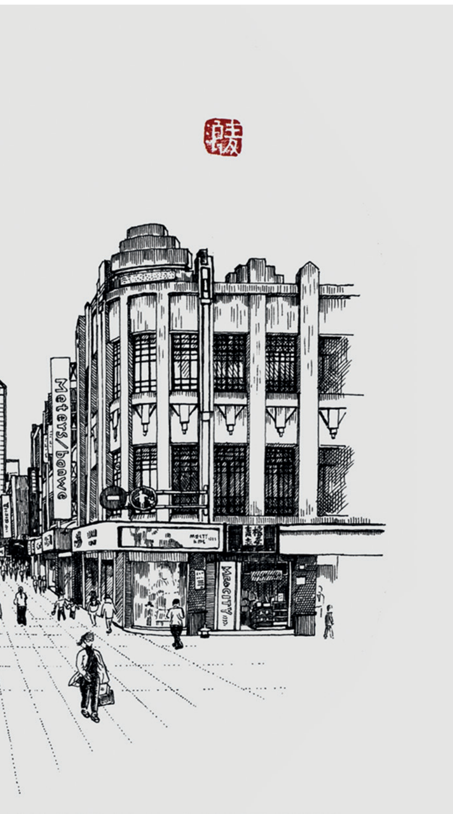
五马街 麦浪钢笔画

本期我们给大家送上一份《温州市历史文化名城地图》，从名城到名镇，再到名村，无不在悠悠岁月里散发着古老文化与现代文明相融的独特魅力和风韵，我们不妨跟着地图去转转，在走街串巷中，倾听娓娓道来的古城故事，感受温州城市悠久的历史蕴涵。在温州市自然资源和规划局、温州市住房和城乡建设局的指导下，为大家带来了《温州市历史文化名城地图》。到目前为止，全市拥有国家历史文化名城1处、中国历史文化名镇2处、中国历史文化名村4处，另有省级历史文化名城2处、名镇8处、名村12处。