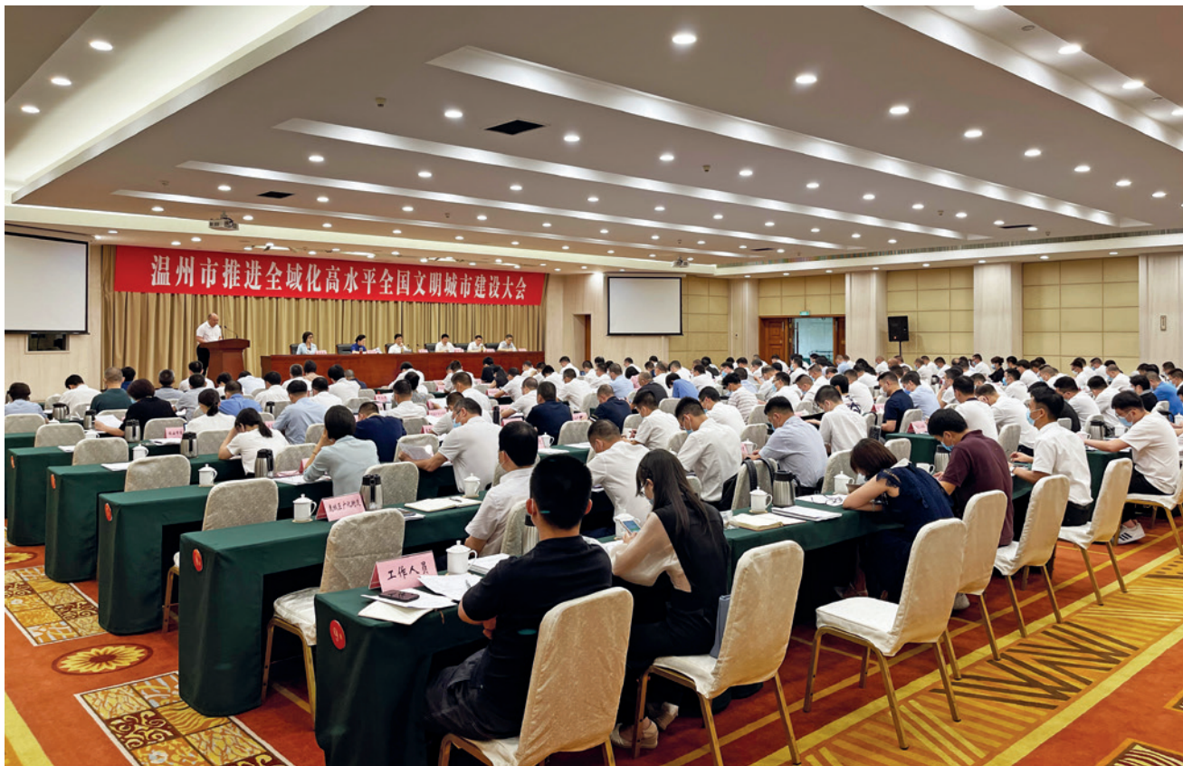
2021年8月5日，温州市召开推进全域化高水平全国文明城市建设大会