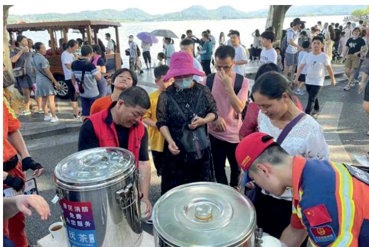
杭州市民在饮用伏茶