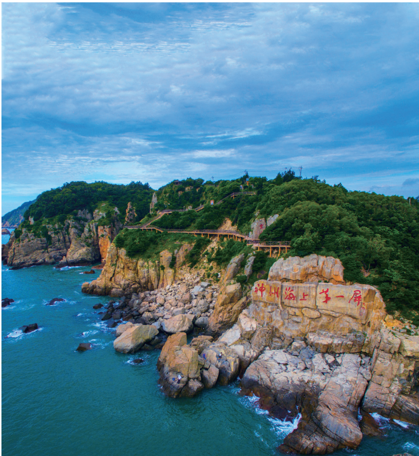
海洋省级旅游度假区——洞头半屏山

半屏山位于温州市洞头区域南 3 公里处，与洞头本岛隔港（洞头渔港）相望。半屏山海洋旅游度假区具有独特的海岛自然景观，生态环境优美，景区东部沿岸断崖峭壁犹如刀削斧劈，直立千仞。山上共有四屏十八景，连绵数千米的海上天然岩雕长廊，在全国堪称一绝，被誉为“神州海上第一屏”。