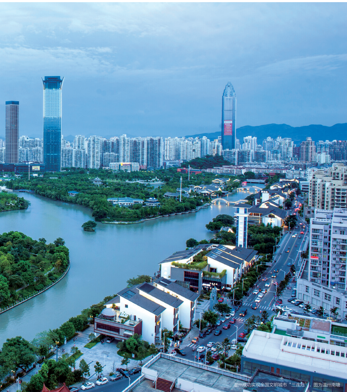
温州成功实现全国文明城市“三连冠”，图为温州南塘