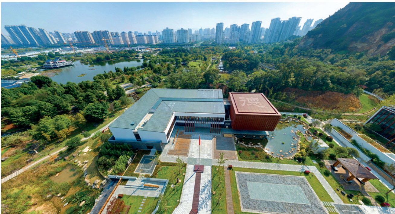
温州道德馆

从制定方案到推进工作到抓贯彻落实，温州市不仅明确了新一轮创建的“路线图”“时间表”，更在全市上下形成共识——到 2023 年，市本级、瑞安市实现高水平蝉联，乐清市、平阳县、泰顺县创成全国文明城市，永嘉县、文成县、苍南县、龙港市力争入围全国文明城市提名城市名单。