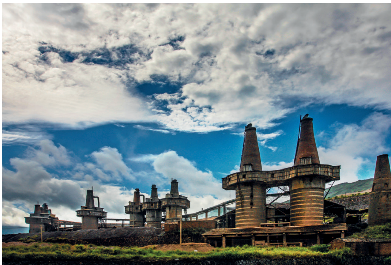
世界矾都遗迹组照之一：第三代煅烧炉