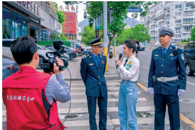
乐清市开展“乐见文明”1+N 系列直播

2021 年 8 月 12 日，为进一步贯彻落实温州市推进全域化高水平全国文明城市建设大会精神，各县（市、区）文明中心、浙南产业集聚区组宣部、瓯江口产业集聚区组宣部、市直有关部门在温州市文明办、市文明中心的牵头下，对标对表、查找短板，推进文明城市建设落细落小落实。