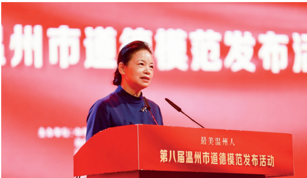
市委常委、宣传部部长胡剑谨向道德模范们表示祝贺并致辞