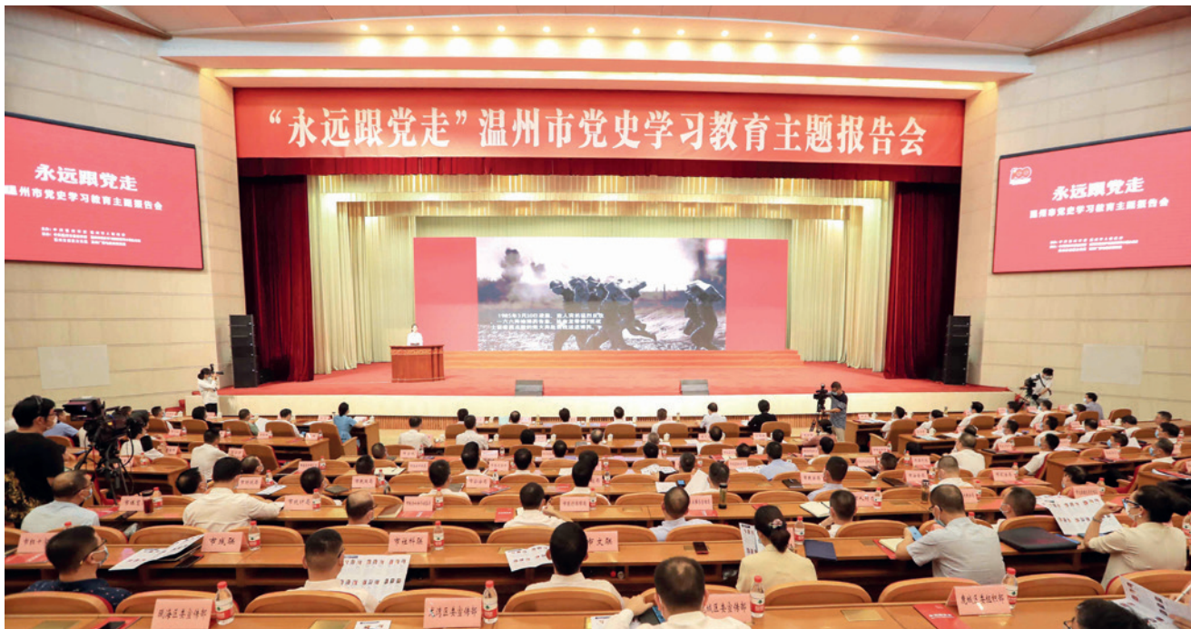
永远跟党走温州市党史学习教育主题报告会