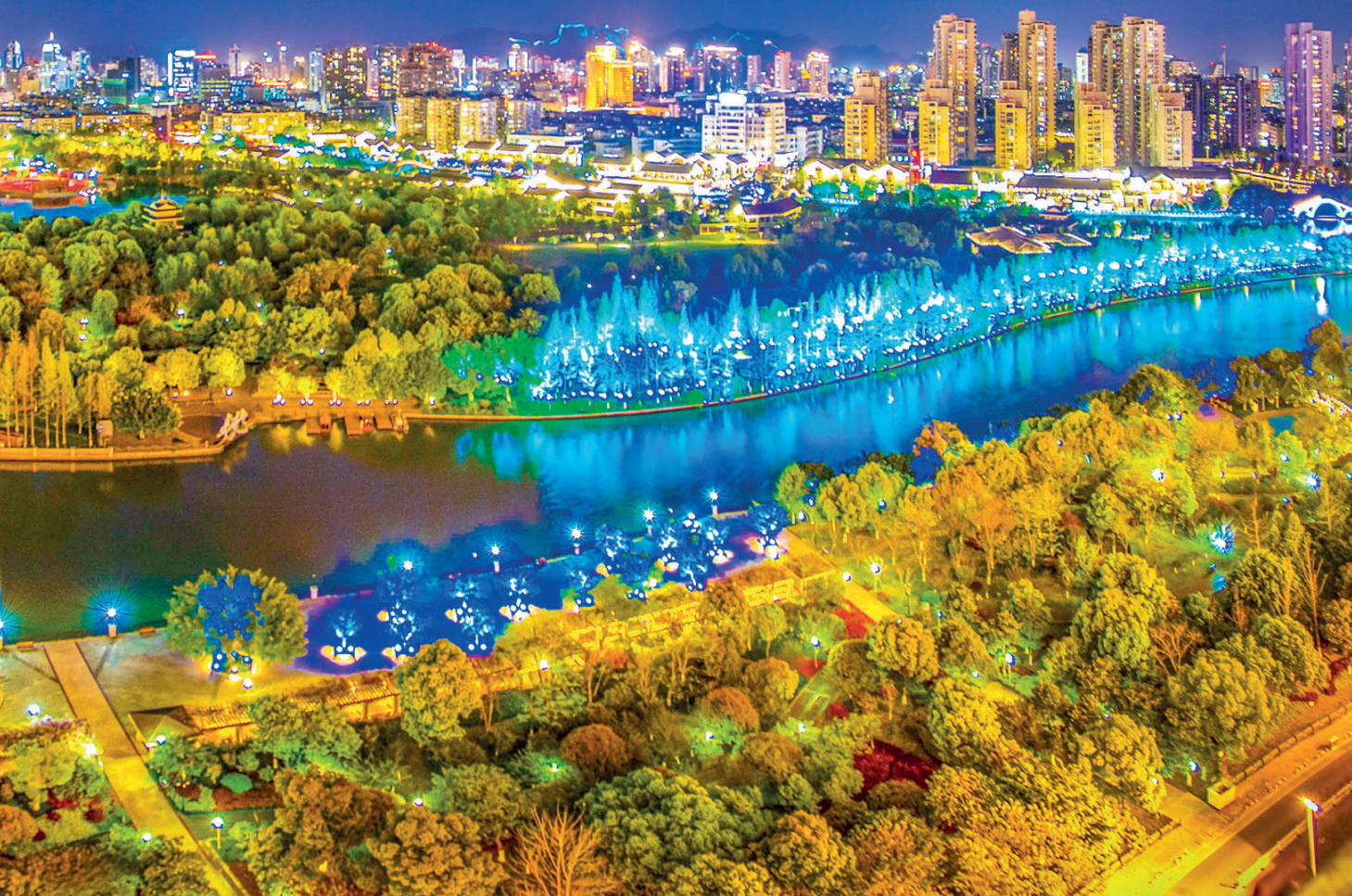
温州市塘河沿线开发建设指挥部围绕“生态塘河、文化塘河、旅游塘河、城市塘河”建设，精心打造亮点项目

全国文明城市创建永远在路上，捍卫荣誉仍需要加倍努力。温州全市上下正满怀激情把文明城市创建推向新的高度，努力实现全域文明、全体文明、全面文明，为打造共同富裕示范区市域样板提供磅礴的精神力量。