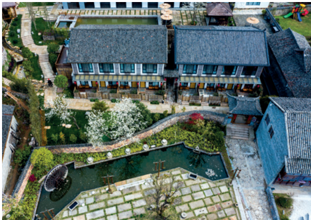
侨家乐 - 开臣璞居