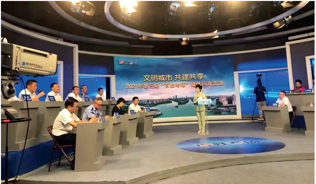
2021年第三场“百姓考场”媒体问政活动