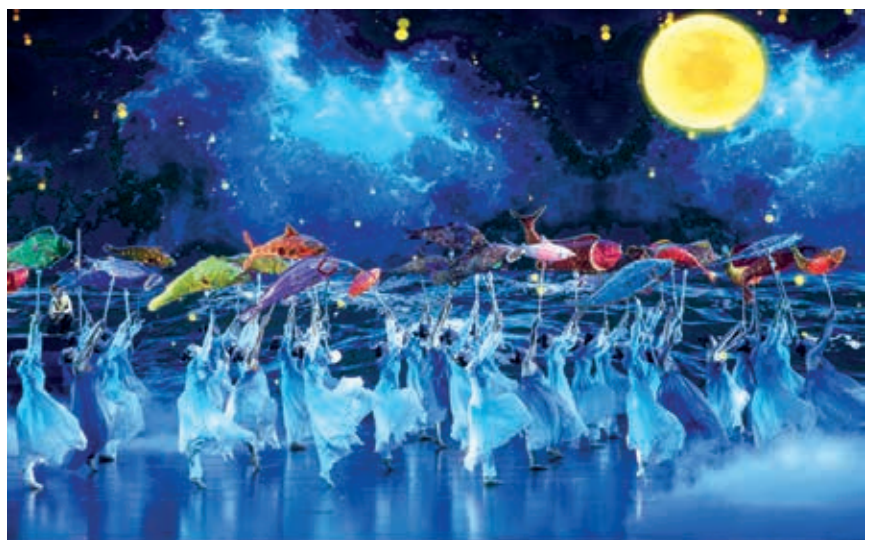
当晚的“宋韵瓯风·经典非遗”文艺演出荟萃省级非遗十余项，国家级与人类非遗六项，带领观众在历史浸润中，感受瓯越子民续写创新史的磅礴声浪

文化合作的重要品牌，自 2013 年启动评选以来，中日韩三国共 29 座城市获此殊荣。温州是中国第十个当选城市。下一步，我市将以东亚文化之都活动年为契机，深入挖掘开放文化、