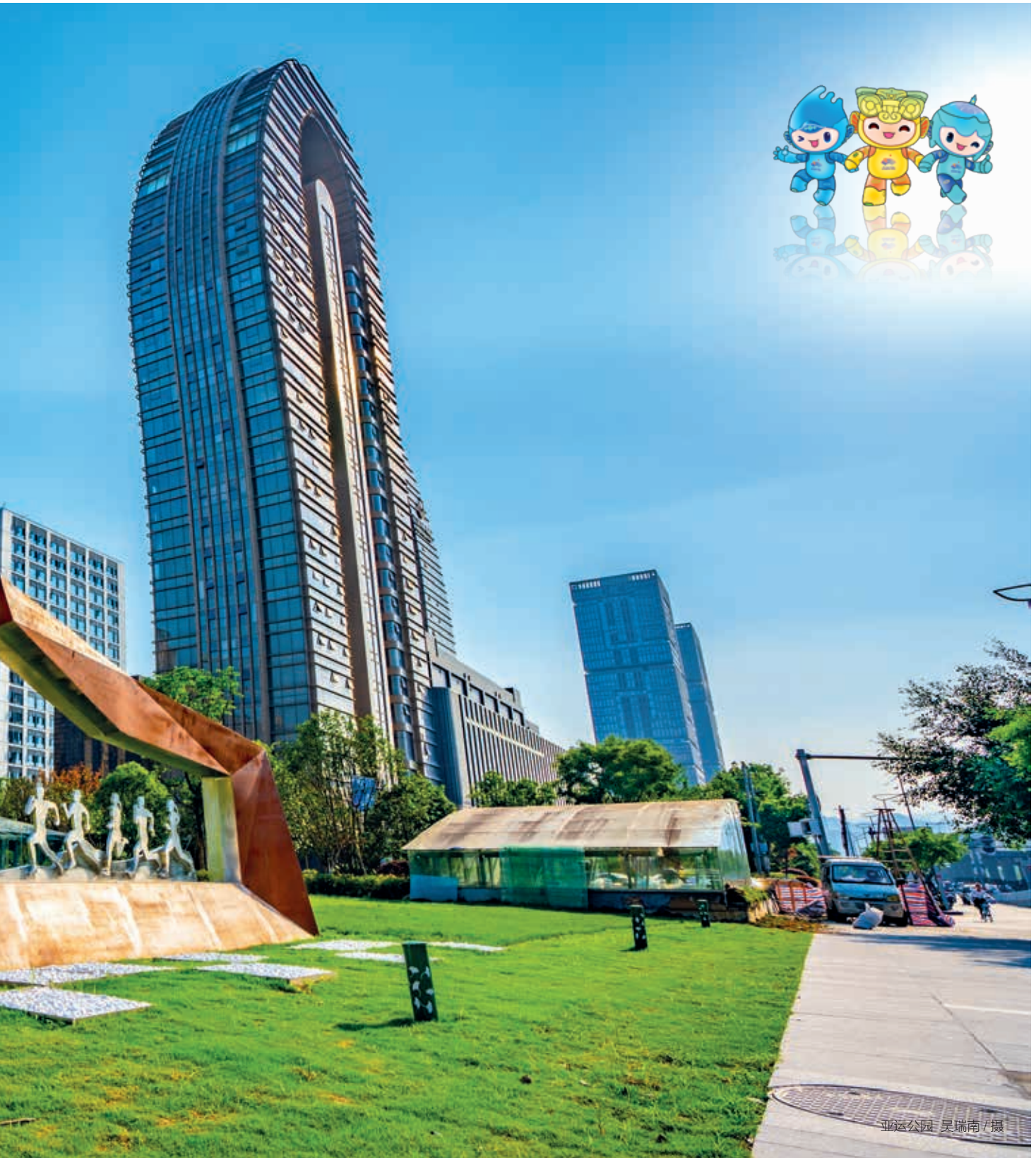
亚运公园