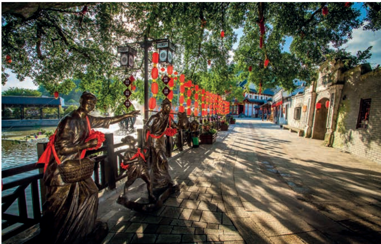
鸣山非遗文创街区

文化广场，引驻、建设、改造、提升鸣山陶院、“鸣竹”学堂、家风家训馆、“小隐庐”婚庆基地，并依托古村落保护利用及“月亮工程”项目，在鸣山村实施古道修复 1500 米、古建筑修复 4 幢、古桥修缮 2 座、主入口提升 1 处、生态停车场 2 处、美丽庭院 14 间、外立面改造 200 间、主题河道 1 条等近 50 余项工程，让古村在现代焕发旅游生机，实现村民增收。“我们通过打造良好的村庄治理环境、生态环境、人文环境与独具特色的村庄风貌，提升旅游资源，进而吸引社会资本入驻，并在试点的五个