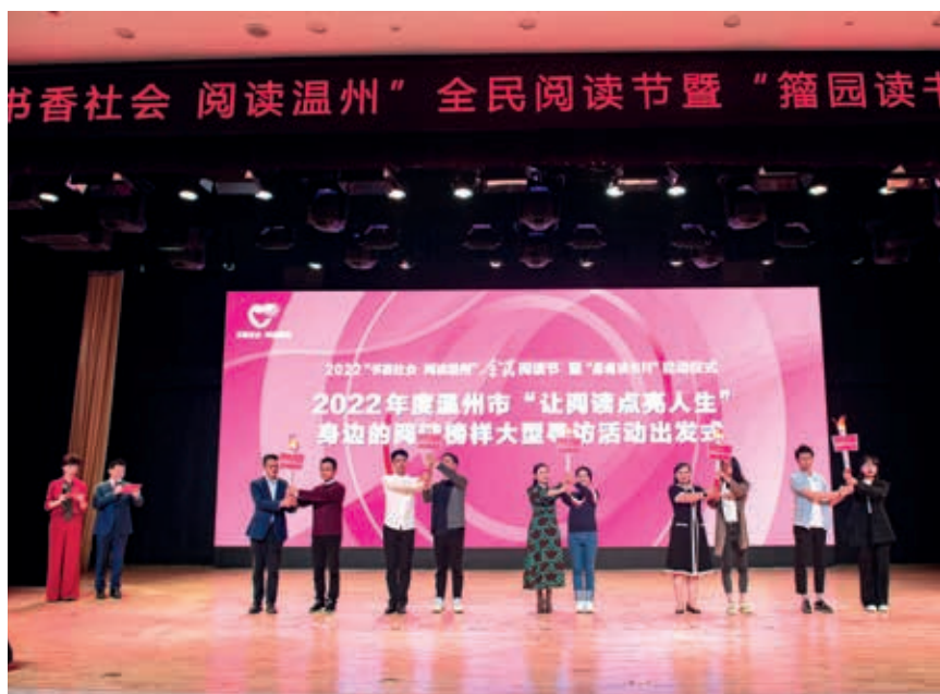
2022年度温州市“让阅读点亮人生”身边的阅读榜样大型寻访活动出发仪式

同时还将广泛开展N项特色活动，比如利用城市书房、农家书屋、实体书店等全民阅读阵地，发动各行各业读书会联盟等团体，精心组织阅读分享会、经典文献诵读、读书好声音、共富故事我来讲、新时代乡村阅读季等各类主题鲜明、内容丰富、形式多样的阅读活动，迎接党的二十大胜利召开；有针对性地开展“行走的阅读·温州名人名家”系列活动、“蝶儿飞”阅读漂流等各类少儿阅读活动；开展“书香政协”委员读书学习系列活动，围绕“我为亚运读书”，开展名家领读、高校智读、社会共读等活动，举办“十二城记”新阅读论坛等，充分发挥名家、高校等文化资源优势，在全社会营造“书香社会、阅读温州”的良好氛围。