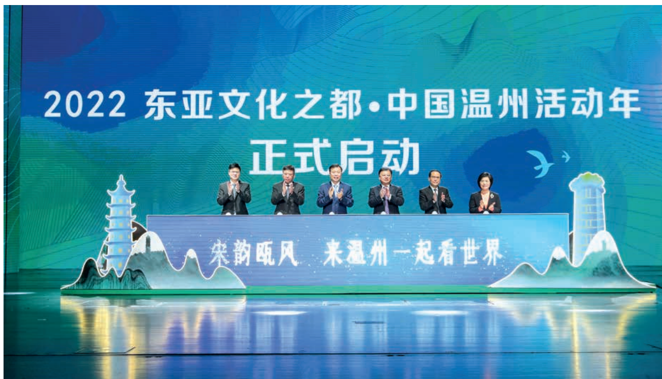
2022 东亚文化之都·中国温州活动启动仪式

四个篇章，与2022世界青年科学家峰会、亚运会温州赛区龙舟比赛、温州国际时尚文化产业博览会、瓯江山水诗路系列活动等联动，开展100余项系列国际交流活动，向世界全方位展示温州的文化气质、文化实力、文化自信。