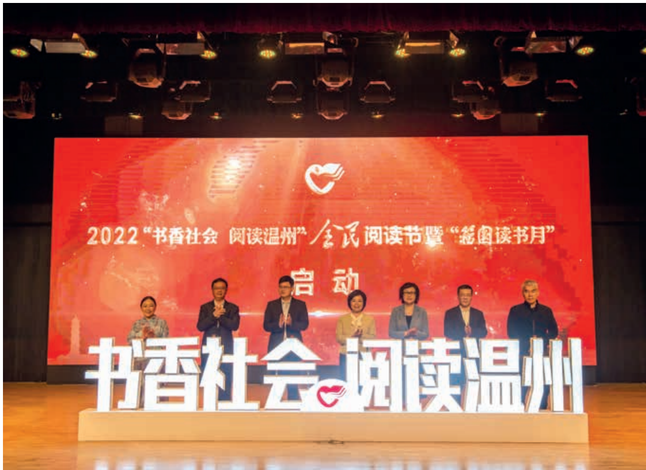
2022“书香社会 阅读温州”全民阅读节暨“籀园读书月”启幕