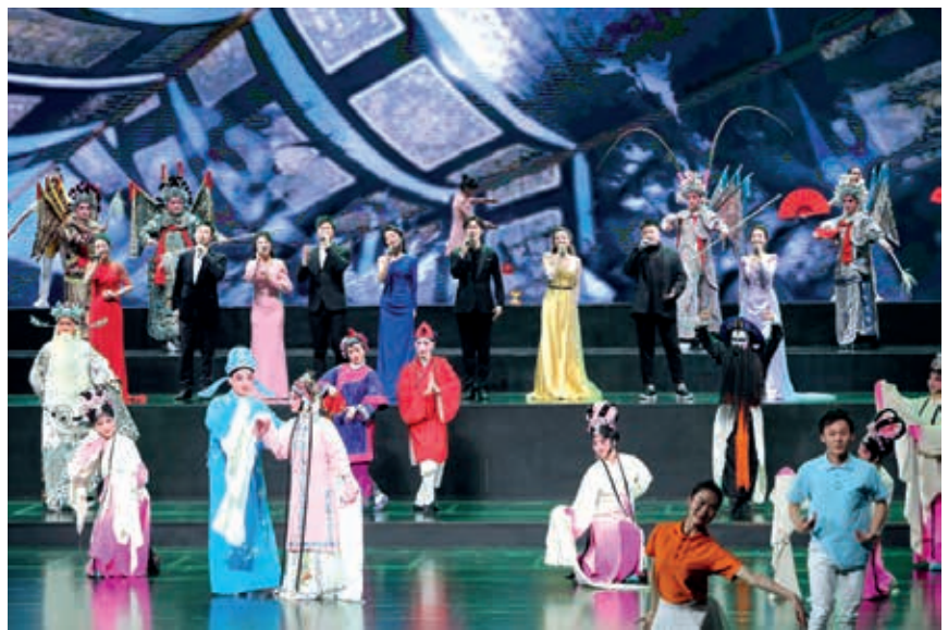
“宋韵瓯风·经典非遗”文艺演出