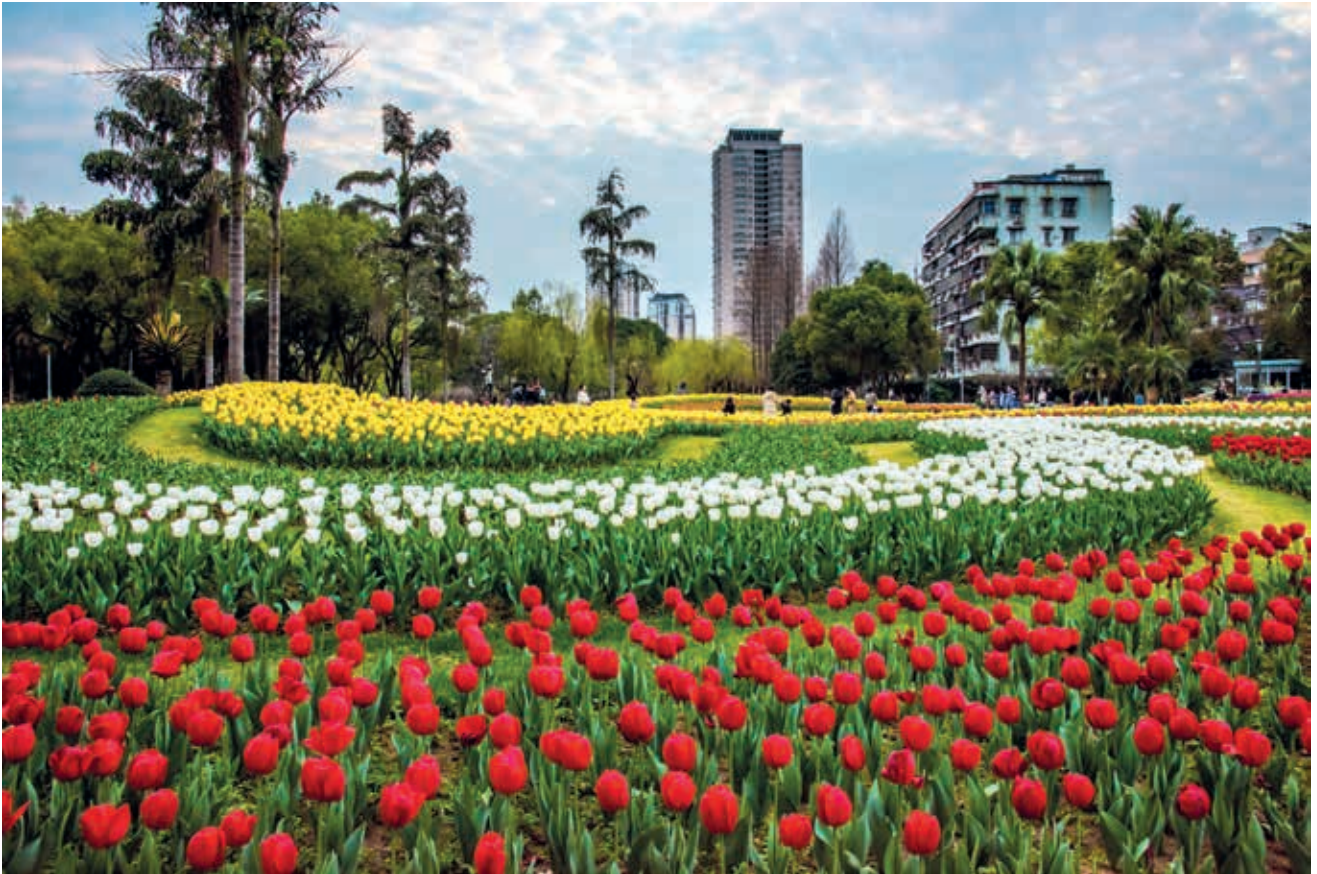
马鞍池公园

开展志愿服务活动，进社区、进楼宇、进学校宣传亚运知识、文明理念，把全民积极性充分调动了起来。