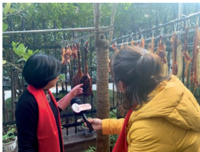
“侨童看瑞安”新春直播走进陈岙