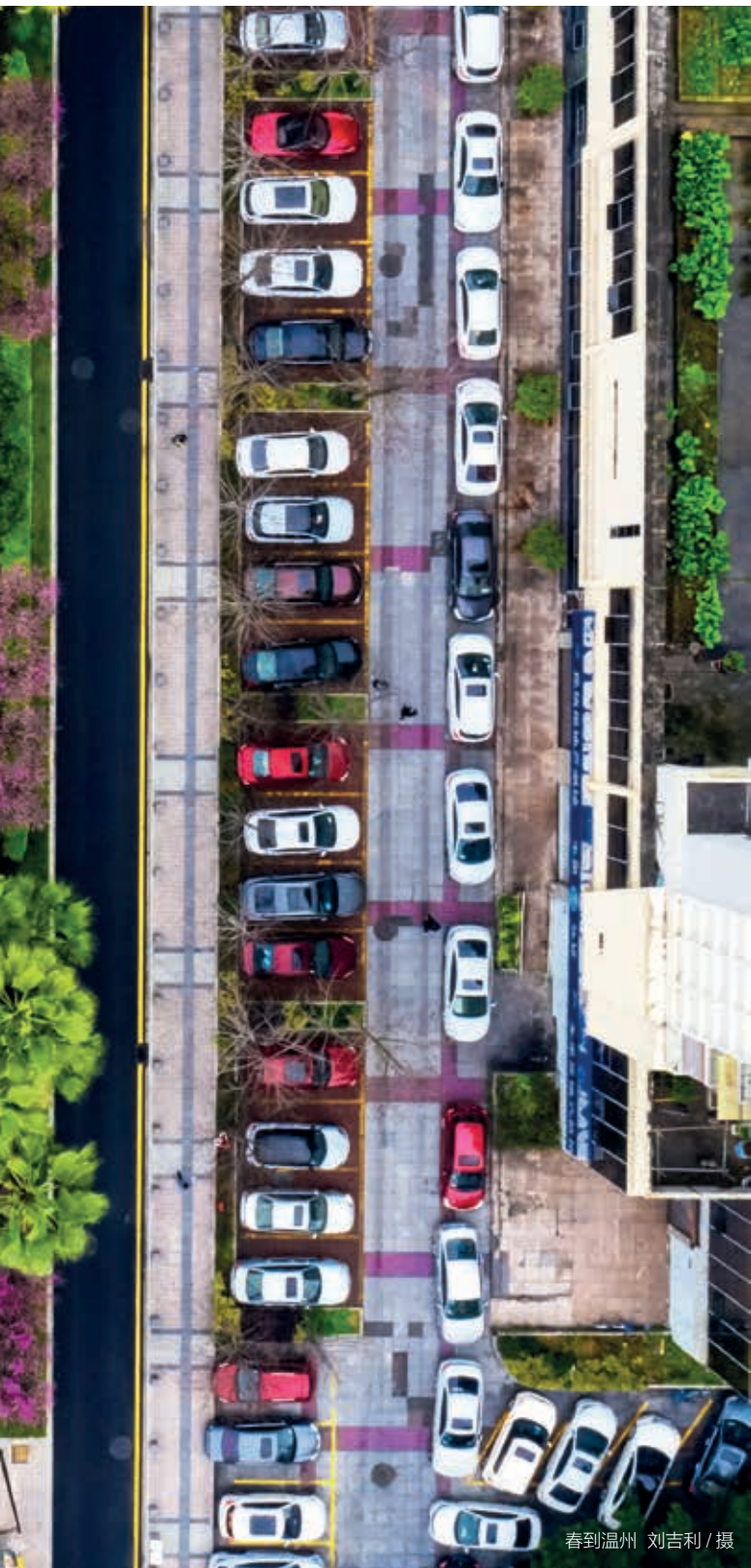
春到温州

与有规范物业管理的新小区不同，我市部分老旧小区由于长期失修失养失管，存在基础设施设备老旧破损、卫生保洁不到位、安全管理难落实等问题，围绕所存在的痛点难点寻找突破口，市文明办协调相关部门、街道、社区等，在老旧小区开展“交通微循环”建设，统一设置电动自行车充电场所和共享单车停放场所等。