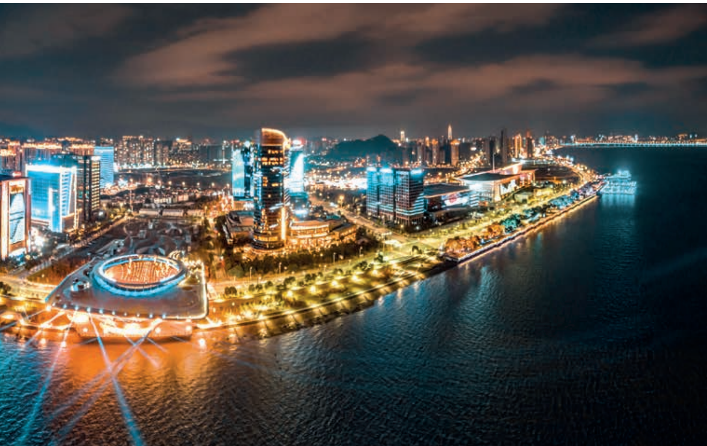
温州市滨江 CBD 夜景

全国文明城市，永嘉、文成、苍南、龙港力争获得全国文明城市提名资格，实现县级全国文明城市创成和提名100%。