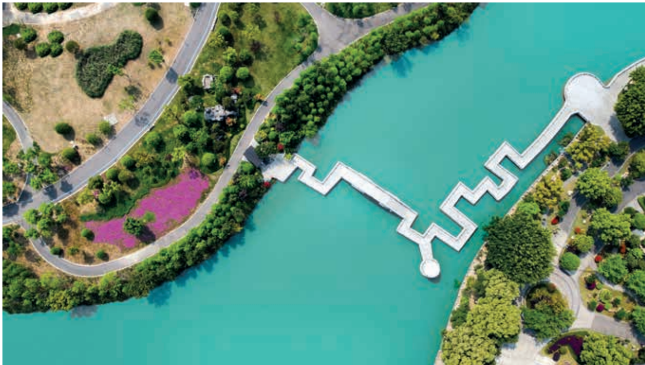
三垟湿地

办好一个会，提升一座城。作为杭州亚运会办赛城市之一，温州将承担龙舟、足球小组比赛，这也是近年来温州承办的最高规格赛事。温州以此为契机，部署开展“迎亚运、讲文明、提品质”十大行动，全面吹响“迎亚运、讲文明、提品质”300天大会战“冲锋号”，进一步打造全域化高水平全国文明城市。