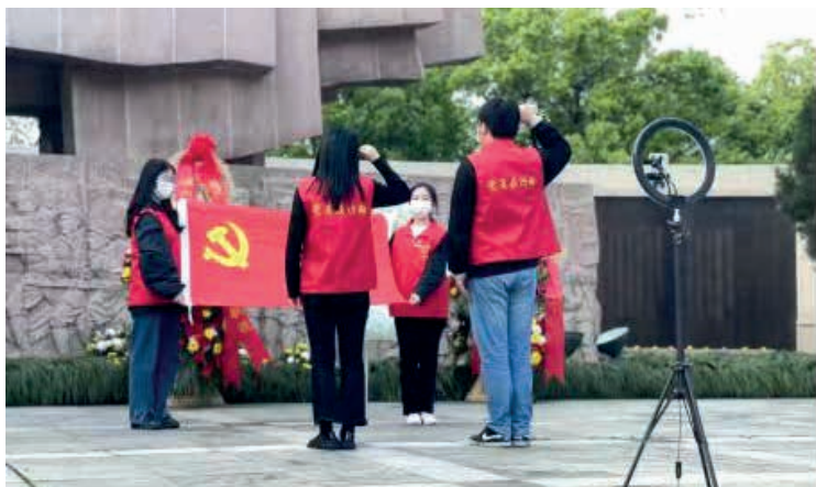
学生在开展“缅怀革命烈士 赓续红色血脉”——“云祭祀”活动，向英雄们致敬。

活动现场，鹿城供电分局志愿者还向当地群众发放安全用电宣传手册，讲解各类防火和电力设施保护知识，并倡议群众减少集聚性祭祀活动，将传统祭扫形式转为网上祭奠、家庭追思、鲜花祭祀等简约方式缅怀先人、寄托哀思，助力营造文明、环保、安全的祭祀氛围。