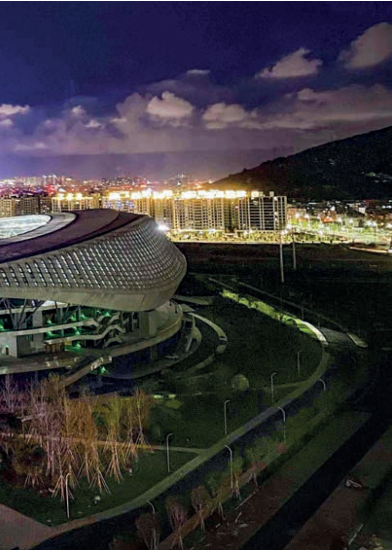
温州奥体中心