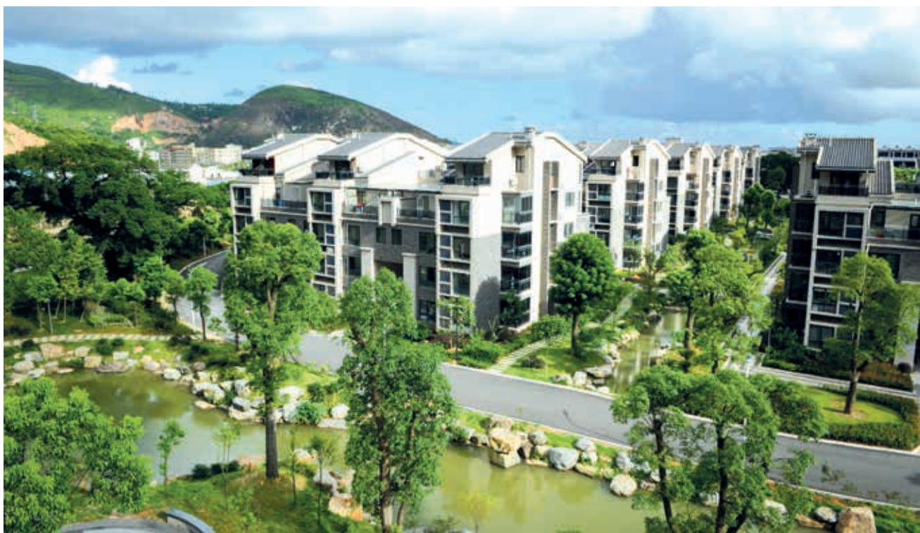
优美宜人的村居环境

全国文明村陈岙村 20 多年来始终坚持党建引领乡村振兴、先行探索共同富裕，践行“绿水青山就是金山银山”的发展理念，抢抓“千村示范、万村整治”契机，深挖“山上银行”资源，以“村集体 + 村民”入股组建九龙观光旅游有限公司，推动资源变资产、变资金，实现村集体收入近 1000 万元，同步探索以党建联盟带动区域共富，联合西河等村，成立九龙区域党建联盟，以产业振兴赋能乡村组团发展，打造乡村“共富标杆”。