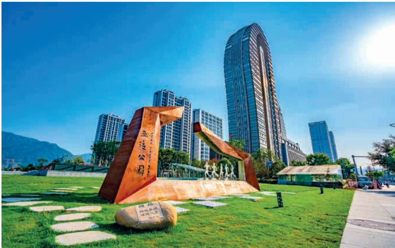
亚运公园